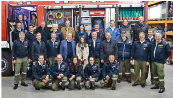
Die Althofener Stadtführung traf auf die örtliche Feuerwehr

„Ich bin beeindruckt, wieviel ehrenamtliche Stunden von jedem einzelnen Mitglied zugunsten der Bevölkerung geleistet werden. Es gilt Euch allen ein großer Dank für den Idealismus und den wichtigen Dienst“, so der Althofener Stadtchef Zemrosser in seinem Restümee über dieses interessante Zusammentreffen.