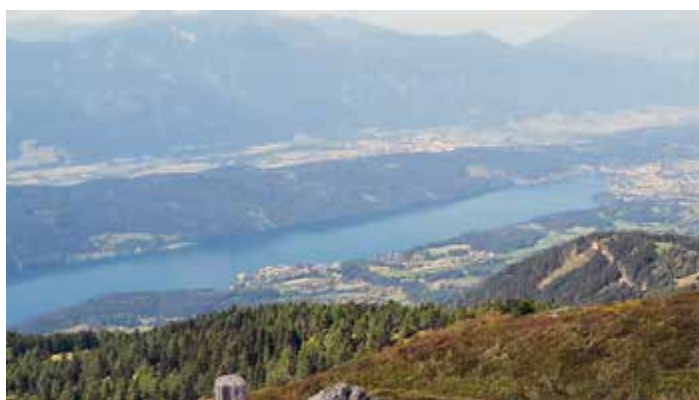
Wunderbarer Blick auf den Millstättersee

den „Stana Mandl“ (2.063 Meter). Nach einem kurzen Fotostopp ging es zum „Granattor“ (2.055 Meter). Dort gab es einen schönen Ausblick auf den Millstätter See. Nach einer Stärkungspause machten wir uns auf zum „Obermillstätter Almkreuz“ (2.046 Meter). Nach einem kurzen Halt ging es über den Enzian-Granat-Steig teilweise über Stock und Stein zurück zur Lammersdorferhütte. Bei der Hütte hatten wir nach rund vier Stunden Wanderung eine kräftige Stärkung verdient! Danach traten wir die Heimfahrt an.