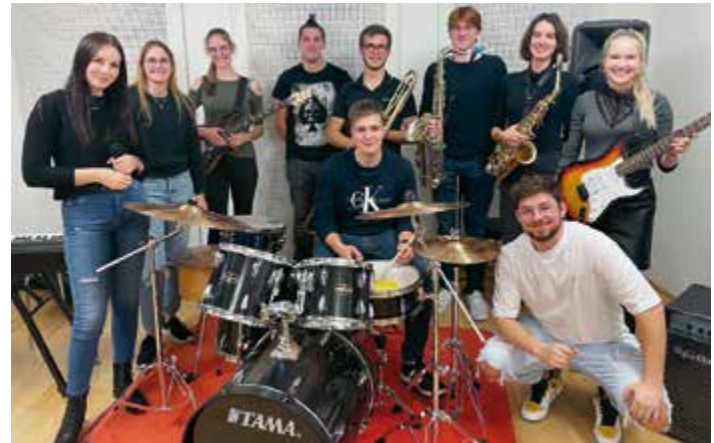
Seventh Moonset bot eine hervorragende Leistung und erreichte den großartigen 1. Platz