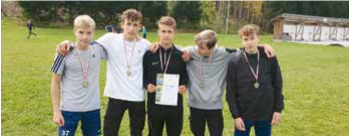
Das sind die Kärntner Vizelandesmeister im Cross-Country-Lauf der Schulen

Cross-Country: Die Läufer der Landwirtschaftlichen Fachschule Althofen (LFS) haben sich über den Sieg bei der Bezirksauscheidung in Brückl für die Landesmeisterschaften im Cross-Country-Lauf qualifiziert. Auch hier haben sie bewiesen, dass sie zu den Schnellsten gehören und sind mit dem 2. Platz die Kärntner Vizelandesmeister im Cross-Country-Lauf der Schulen.