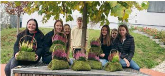
Mit Begeisterung fertigten die Schülerinnen und Schüler dekorative Handtaschen

Die bunte Herbstzeit inspiriert unsere kreativen Schülerinnen und Schüler. Mit Begeisterung haben sie dekorative Handtaschen gemacht, die leicht anzufertigen sind. Maschendraht in der gewünschten Größe zuschneiden, mit Moos füllen, zusammenklappen und mit Blumen eigener Wahl füllen. Den letzten Schliff gibt der Henkel, aus Astwerk gebogen, und schon kann die Dekoration schmückend platziert werden.