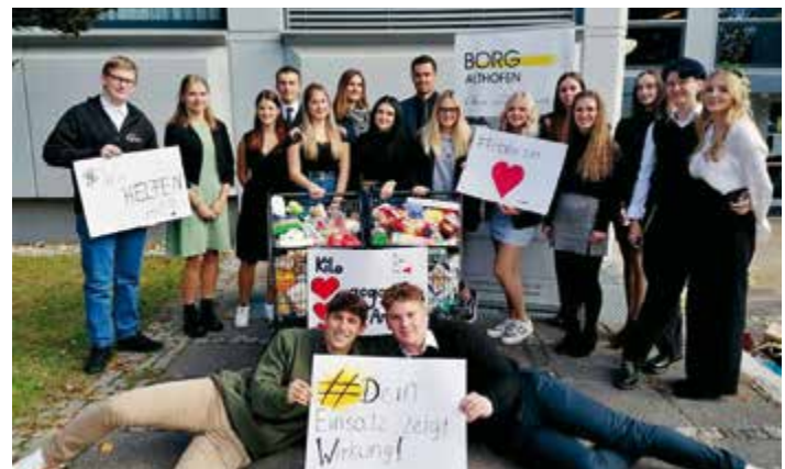
Schülerinnen und Schüler stellten sich in den Dienst der guten Sache