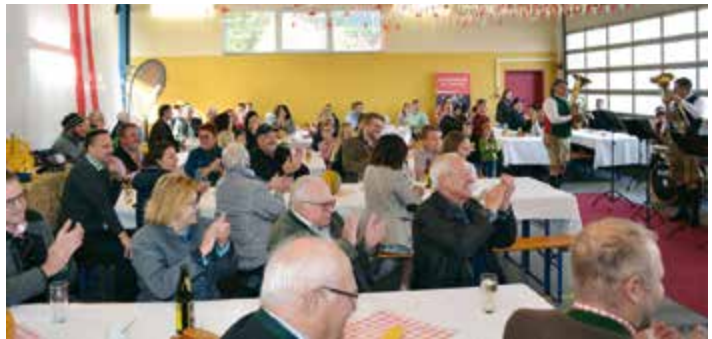
Gesellige Stunden wurden in einem urig-gemütlichen Ambiente verbracht