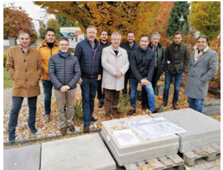
Verschiedene Materialien, die für unseren neuen Hauptplatz in Frage kommen, wurden bei der Bereisung besichtigt