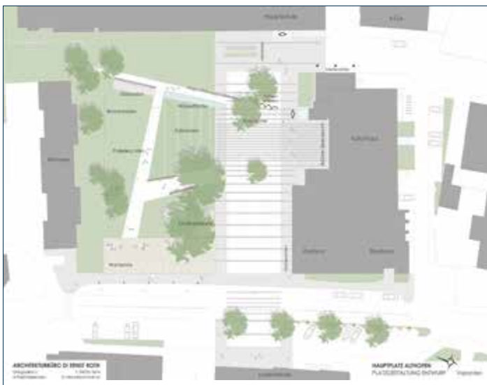
So sieht die Gestaltung des neuen Hauptplatzes aus