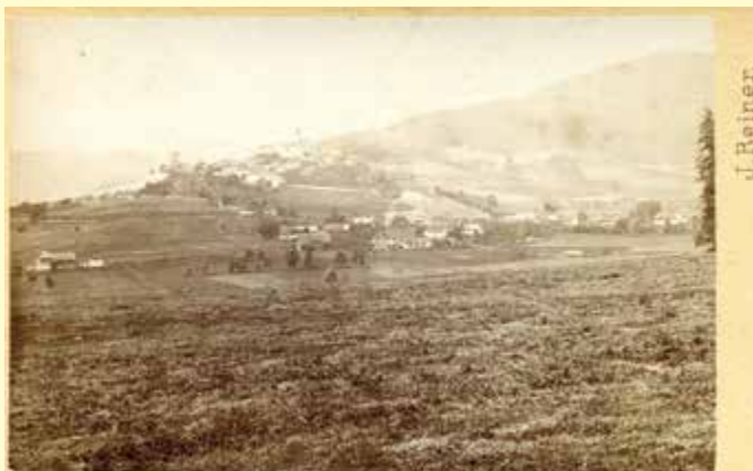
Die älteste Fotografie von Althofen im Visitformat, 1866

Text: Slowenisches Online-Lexikon und Archiv Treibach-Nostalgie Zusammenstellung: Christian Worofka