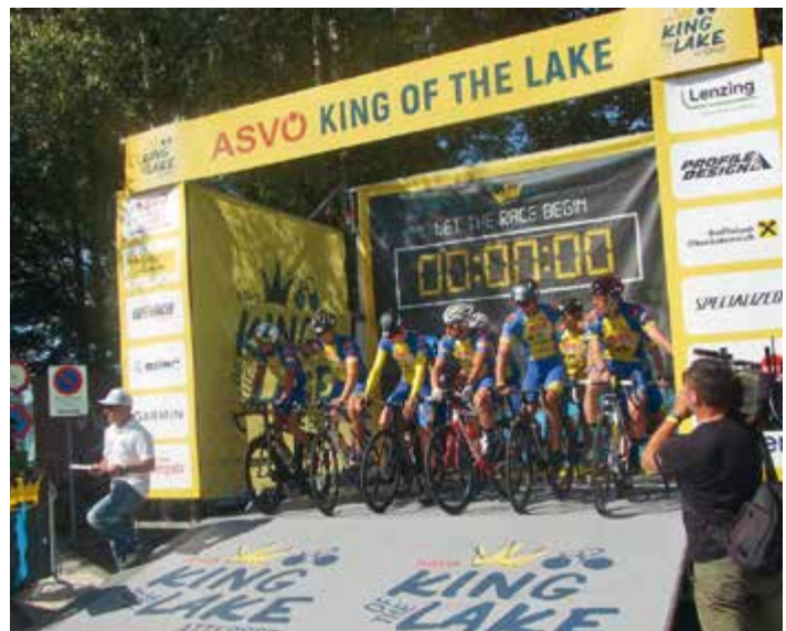
Der Radclub ÖAMTC Raika Althofen punktete mit großartigen Erfolgen und einer tollen Veranstaltung