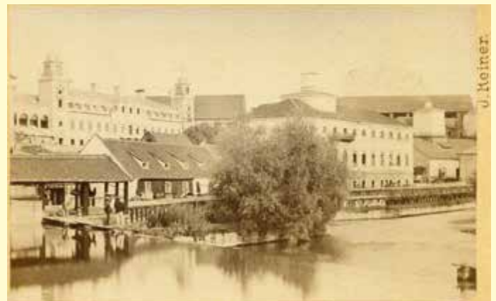
Treibach im Visitformat (9x6 cm) 1866