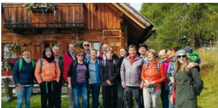
Mitglieder des Chores wanderten auf der Hochrindl

Den Abschluss bildete ein gemütliches Beisammensein in der „Bauernstubb“, wo wir uns an köstlichen Speisen und Getränken labten und es uns gut gehen lassen durften. Eine gelungene Sache, die durchaus nach einer Wiederholung verlangt.