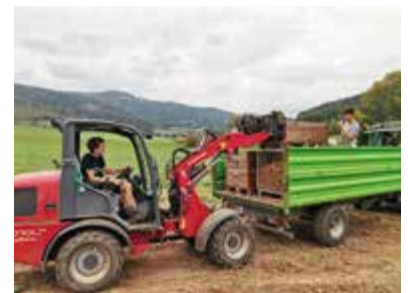
Hier wurden die Kartoffeln sorgfältig für die Lagerung vorbereitet

Herbstzeit ist Erntezeit, auch an der Fachschule Althofen. Von der Urproduktion bis zum köstlich gekochten Gericht wird hier Nachhaltigkeit gelebt. Hier wurden die Kartoffeln geerntet, sortiert und für die Lagerung vorbereitet.