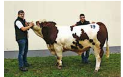
Die Schüler präsentierten den prachtvollen Stier

Einen großen Auftritt hatte die LFS Althofen bei der Zuchtrinderversteigerung in St. Donat. Der Fleckviehstier „BASIC Haarland“, gezüchtet am Schulgut in Althofen, wechselte um 4.000 Euro den Besitzer. Seine Spitzengenetik wird in der Fleckviehherde am Gut der LK Kärnten am Ossiacher Tauern eingesetzt. Die Schüler präsentierten den prachtvollen Stier im Verkaufsring und trugen so zum Erfolg bei, wie natürlich auch die Schülerinnen, die in der Vorbereitung aktiv waren.