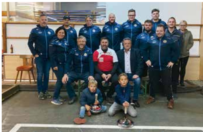
Viele Ratschläge holten sich die Mitglieder beim Weltmeister