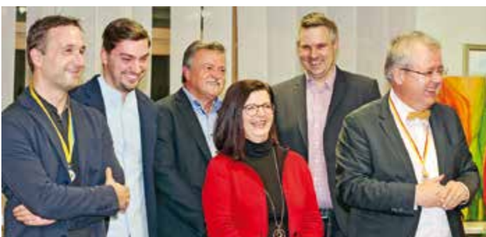
Die Proklamation der Faschingsgilde war sehr erheiternd