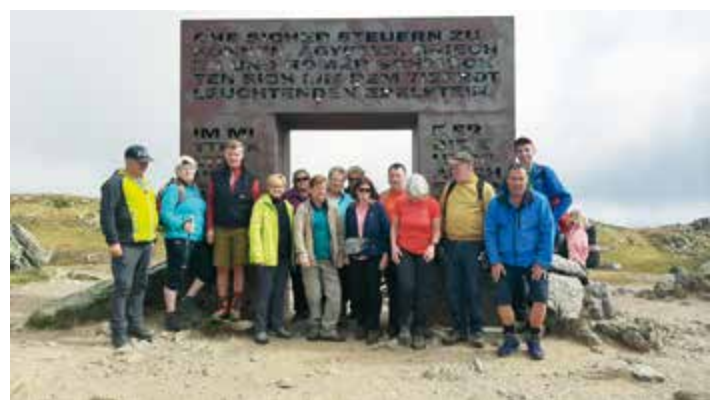
Die Wanderer beim Granattor