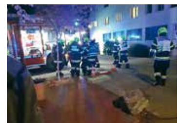
An der LFS Althofen führte die Feuerwehr Althofen eine Übung durch

Alarm! Gelungene Probe für den Ernstfall! An der LFS Althofen fand in Absprache mit der Feuerwehr Althofen eine Übung statt. Die Räumung erfolgte nach dem Alarm rasch und diszipliniert. In der verrauchten Schule suchten Atemschutztrupps nach vier „abgängigen Schülern“. Sie wurden rasch gefunden und über das Stiegenhaus beziehungsweise über die Leiter geborgen. Im Anschluss freuten sich die Feuerwehrleute über eine Verköstigung im Speisesaal der Schule. Der Dank gilt der Feuerwehr Althofen für die gute Zusammenarbeit!