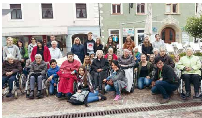
In der FR Betriebs- und Haushaltsmanagement wird mit zahlreichen Organisationen zusammengearbeitet