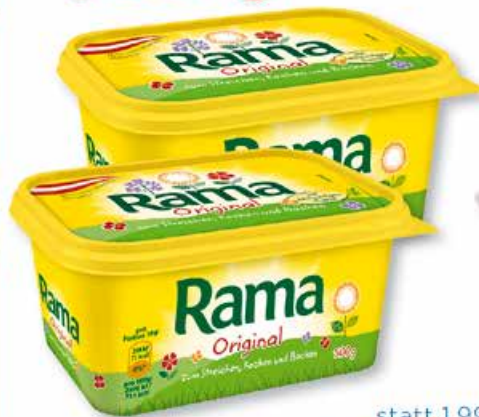
Rama Becher 500 g, 1 kg = 1.98

FILIALE ALTHOFEN Wir freuen uns auf Sie!