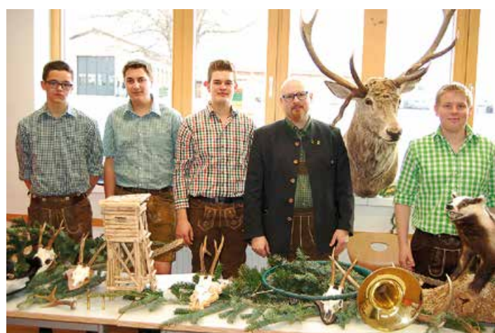
Die Ausbildung zum Jungjäger findet großes Interesse

All jenen, die sich entscheiden gleich eine Schule mit Matura zu machen, bietet die Agrar-HAK ein optimale Möglichkeit, eine gute wirtschaftliche Ausbildung in Verbindung mit einem starken Praxisbezug zu erreichen. Selbstverständlich stehen auch den SchülerInnen der Agrar-HAK unsere Werkstätten und der Schulbetrieb zur Verfügung. Auch hier bietet das Pflichtpraktikum in einem Betrieb nicht nur eine wertvolle Ergänzung, sondern schafft auch die Möglichkeit, Betriebe kennenzulernen und einen Blick in die reale Arbeitswelt zu werfen. Mit der Matura in der HAK und dem Facharbeiterbrief der Landwirtschaft, stehen den AbsolventInnen alle Türen im Berufsleben und selbstverständlich auch alle Universitäten offen. Wir laden alle herzlich zu unserem Tag der offenen Tür am 18. Jänner 2018 von 10.00 bis 17.00 Uhr ein. Nutzen Sie die Möglichkeit sich vor Ort zu informieren.