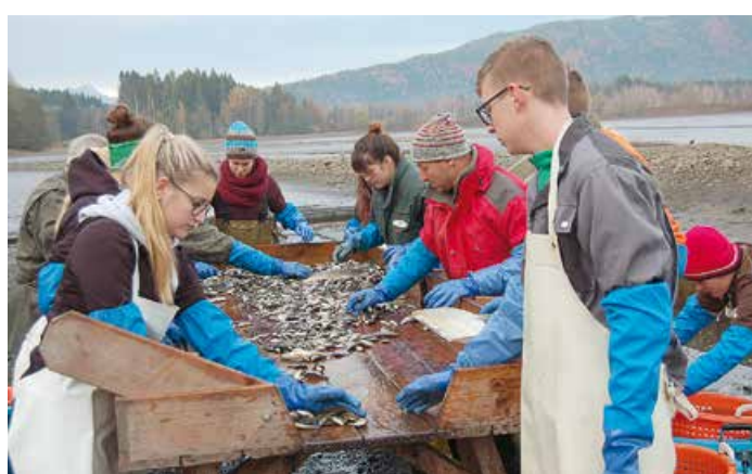
Auch das Kennenlernen von alternativen Einkommensquellen spielt eine wichtige Rolle und lockert den Schulalltag auf

Zippusch GmbH Gutschen 44 9372 Eberstein +43 664 3201850 +43 4264 8109 office@holzschindeln.at www.holzschindeln.at