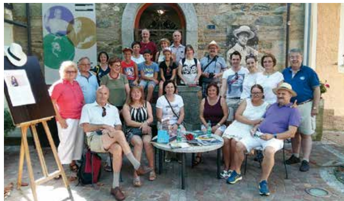
Die SängerInnen vor dem Hermann-Hesse-Haus in Montagnola bei Lugano/Schweiz

Gelegenheit bedankt sich die Redaktion für die übersendeten Grüße des Gemischten Chores. Die gesanglichen Botschafter Althofens nutzten die Reise in die Schweiz übrigens auch, um einen Abstecher zu den Filmfestspielen in Locarno zu machen.