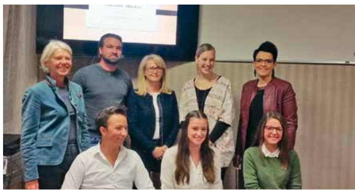
Teilnehmer an der Präsentation im Stadtamt.

Abschließend auch ein Dankeschön an alle Eltern der Volksschulkinder von Althofen für das Ausfüllen der Fragebögen!