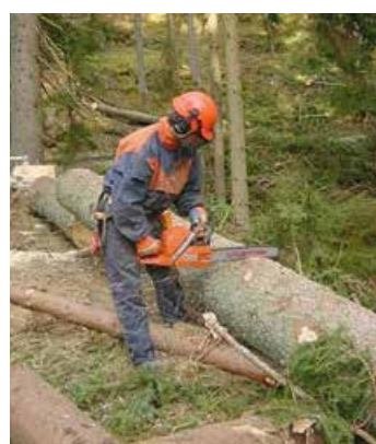
Auch die Forstwirtschaft ist ein Schwerpunkt in der FR Landwirtschaft