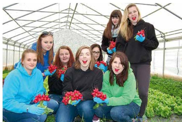
Gartenbau – Ernten, was im praktischen Unterricht gesät wurde

In der Fachrichtung Landwirtschaft liegen neben einer fundierten Grundausbildung die Schwerpunkte im Bereich der Mutterkuhhaltung mit Fleischrinderzucht, sowie der Forstwirtschaft. Seit einem Jahr ist auch die Ausbildung zum Jungjäger mit in den Unterricht eingegliedert. In der Fachrichtung ländliches Betriebs- und Haushaltsmanagement liegt der Schwerpunkt im sozialen Bereich. Selbstverständlich gehören auch die Ernährung, das Kreative und andere wertvolle Inhalte, die uns täglich im Leben begleiten, zu unserem Ausbildungsprogramm. Neben der notwendigen Theorie in unseren neuen Klassenräumen, findet die praktische Ausbildung in modern eingerichteten Lehrwerkstätten und am schuleigenen Lehrbetrieb statt. Ein 8-wöchiges Pflichtpraktikum zwischen der 2. und 3. Klasse rundet die lebensnahe Ausbildung optimal ab.