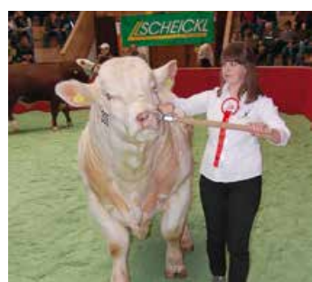
Die Fleischerinderzucht als ein Schwerpunkt in der FR Landwirtschaft – zahlreiche Erfolge auf Landes- und Bundesebene bei Rinderschauen motivieren unsere SchülerInnen