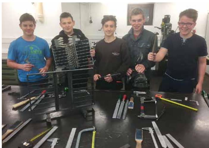
Metallbearbeitung als Grundlage für die späteren Arbeiten in der großen Landtechnikwerkstätte