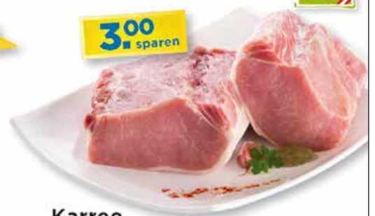
Karree ausgelöst, ohne Schwarte vom premium Schwein für saftige Steaks oder zum Braten per kg