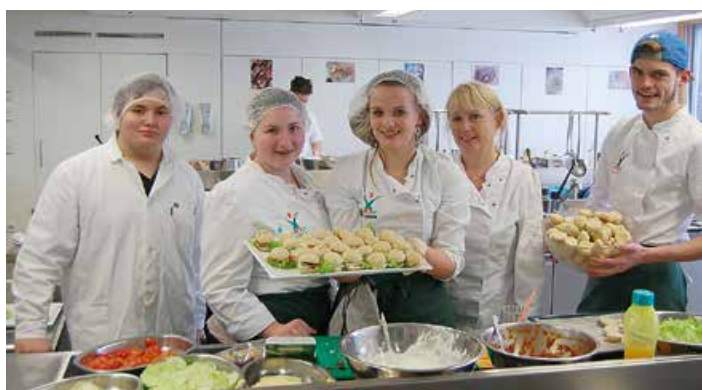
Ernährung und Haushalt, wichtige Themen die uns alle täglich betreffen, sind in der FR Betriebs- und Haushaltsmanagement wichtige Inhalte