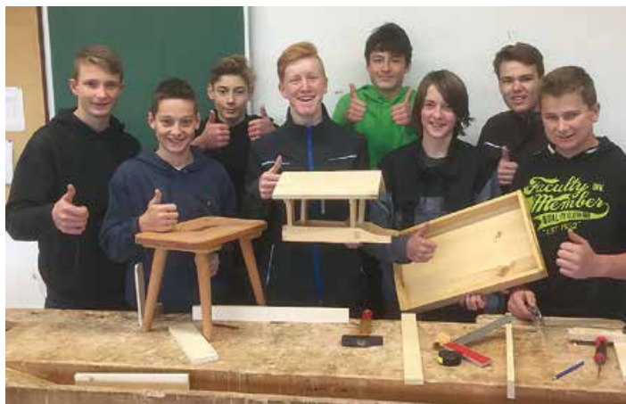
In der Holzbearbeitung werden die Grundkenntnisse im Holzbau vermittelt, die später in der Baukundepraxis bis zu Zimmerarbeiten ausgebaut werden

Die Ausbildungsmöglichkeiten an der LFS Althofen sind breit gefächert. Für Praktiker steht die 3-jährige Fachschule, die mit dem Facharbeiterbrief endet, zur Verfügung. In drei Jahren werden hier junge Menschen optimal auf die Übernahme eines Betriebes oder auf eine anschließende Lehre vorbereitet. Auch der Besuch eines Aufbaulehrganges an einer Mittelschule ist im Anschluss möglich. Egal ob in der Fachrichtung Landwirtschaft oder im Betriebs- und Haushaltsmanagement, unsere AbsolventInnen sind von der umfangreichen Ausbildung begeistert.