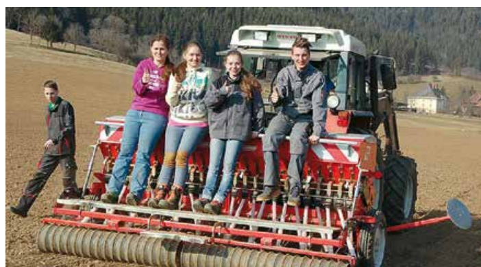
Die Bestellung und Pflege unserer Felder am Schulgut Weindorf erfolgt durch unsere SchülerInnen in den Praxiseinheiten