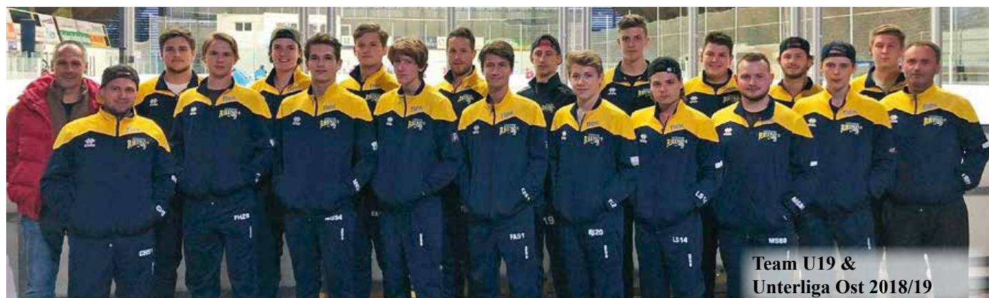
Team U19 & Unterliga Ost 2018/19