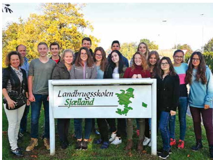
SchülerInnen der LFS und Agrar-HAK Althofen freuen sich über die Praxiserfahrung an der Roskilde Tekniske Skole in Dänemark.

Mit der Erasmusförderung für jene, die das Pflichtpraktikum im europäischen Ausland verbringen, hat die landwirtschaftliche Fachschule Althofen einen weiteren Schritt für internationale Ausbildung gesetzt. Derzeit läuft mit Unterstützung von Günther Prommer, Koordinator für EU-geförderte Schul-Mobilitätsprojekte, ein Schüleraustauschprojekt mit Dänemark. Während Jugendliche der Fachschule und Agrar-HAK Althofen Erasmus gefördert dänische Landwirtschaft, Kultur und Sehenswürdigkeiten erkunden, befinden sich Austauschstudenten aus Dänemark zeitgleich an der Fachschule Althofen. Beide Schulen schätzen die gegenseitige Bereicherung und die teilnehmenden SchülerInnen freuen sich über diese einmalige Chance.