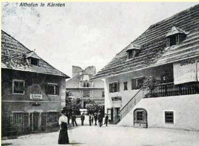
Ansicht um ca. 1890