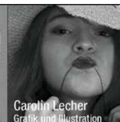
Carolin Lecher Grafik und Illustration