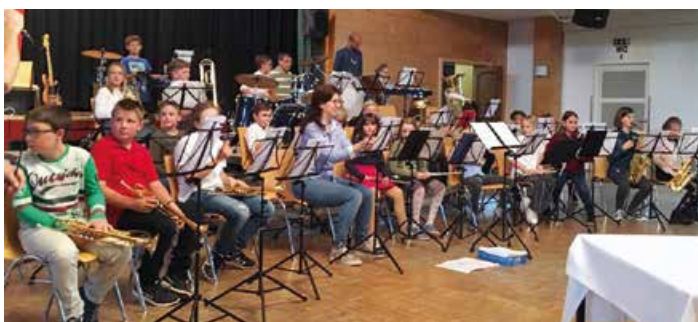
Ein Erlebnis der Sonderklasse war die Auftaktveranstaltung der Bands der MUSIKSCHULE ALTHOFEN: Geniale Einzelkünstler und vielversprechende Popkünstler vereint auf der Bühne ...

Einen Bilderbogen über viele Veranstaltungen des ALTSTADTSOMMERS finden Sie im folgenden Bilderbogen: