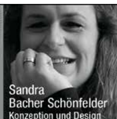
Sandra Bacher Schönfelder Konzeption und Design