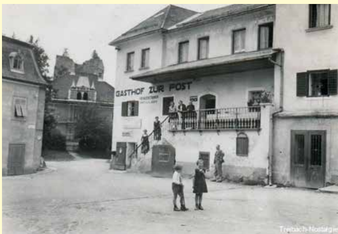
Ansicht um ca. 1940