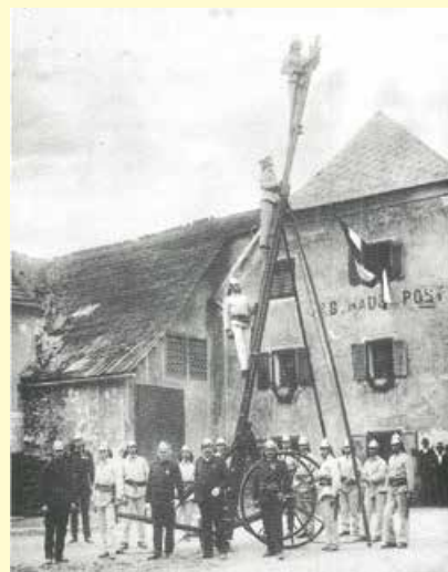
Südansicht mit noch angebautem Stall um 1934

An der Südwest-Seite war ehemals ein Stallgebäude angebaut, welches nach 1935 abgetragen worden ist.